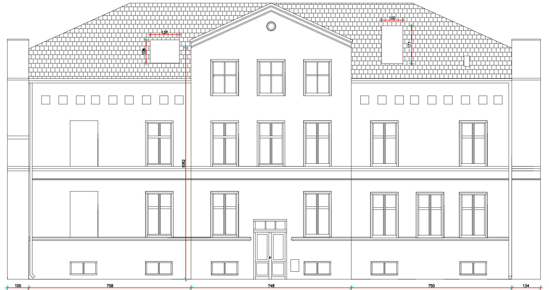
Elewacja boczna prawa